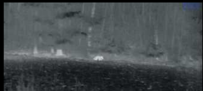
Ein Fuchs schnürt auf 60 Meter Entfernung. Hier zeigt sich die sehr gute Bildqualität der Liemke M640.

Eine Sau betritt in der Nacht die Bühne, steht im Bestand noch die Rotte? Zieht noch was nach? Mit der Wärmebildkamera kann man Klarheit schaffen.