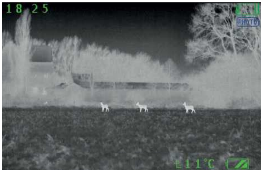
Eine Geiß mit zwei Kitzen in ca. 80 Meter Entfernung. Links im Hintergrund steht ein weiteres Stück Rehwild. Gespeichert auf dem Top-Gerät Liemke M 640.

Eine Infrarot- ist im Prinzip wie jede Digitalkamera aufgebaut. Das Licht fällt auf einen Sensor, der setzt das Bild auf einen Monitor um. Der Unterschied ist jedoch, dass der Sensor in einer Infrarotkamera nicht Helligkeit und Farbe erfasst, sondern Temperaturunterschiede ermittelt. Das erzeugte Bild zeigt dann, wo sich kalte und warme Flächen befinden. Und da der Wildkörper wärmer als seine Umgebung ist, wird dieser in der Infrarotkamera sichtbar. Um ein brauchbares Bild zu erzeugen, muss der Sensor eine gewisse Auflösung haben. Die aktuellen Sensoren liegen zwischen 240 x 180 und 640 x 480 Pixel. Selbstverständlich spielt die Optik, durch die das Licht den Sensor erreicht, eine erhebliche Rolle bei der Abbildungsqualität. Eine weitere Eigenschaft, die von Bedeutung ist, ist die Bildwiederholrate. Um ein wirklich ruckelfreies Bild erzeugen zu können, braucht es mindestens 25 Hz. Die Bandbreite der von uns getesteten Kameras liegt zwischen 9 und 50 Hz und zeigt,