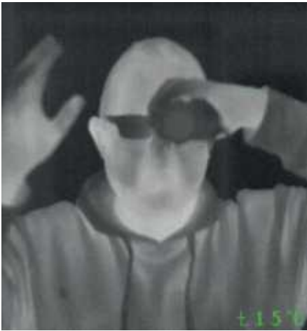
Der Blick durch eine Fensterscheibe scheitert. Man sieht sich selbst.

Ich habe nun seit fast drei Jahren eine Infrarotkamera immer dabei. Das Modell ist ein Scout PS 24 von FLIR. Durch die geringe Baugröße kann man sie gut im Jagdrucksack verstauen. Ich habe viel Wild erst durch die Kamera gesehen – und hätte einiges ohne die Kamera sicher gar nicht entdeckt. Bei diversen Nachsuchen haben wir durch den Einsatz das Stück gefunden und brauchten keinen Hund. Die Kamera dabeizuhaben, ist für mich ein echter Vorteil. Auf dem Hochsitz genieße ich es, mal eben zu schauen, ob sich was getan hat. Irgendwann hatte ich mir aber mal geschworen, mit möglichst wenig Tech-