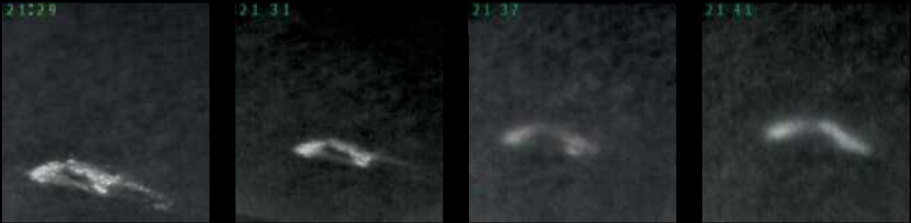
Die Testreihe zeigt eine 37 Grad Celsius warme Flüssigkeit auf einem 4 Grad Celsius kalten und feuchten Boden. Nach etwa 12 Minuten hat die Flüssigkeit die Temperatur des Bodens angenommen. Die Bildreihe startet bei 21.29 und endet bei 21.41 Uhr. Damit zeigt sich, dass es bei der Nachsuche flott gehen muss, um den Schweiß durch die Kamera zu lokalisieren.