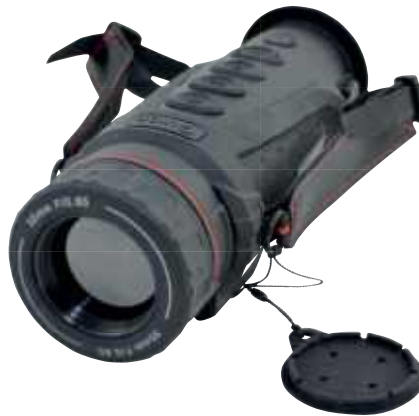
Guide IR 517