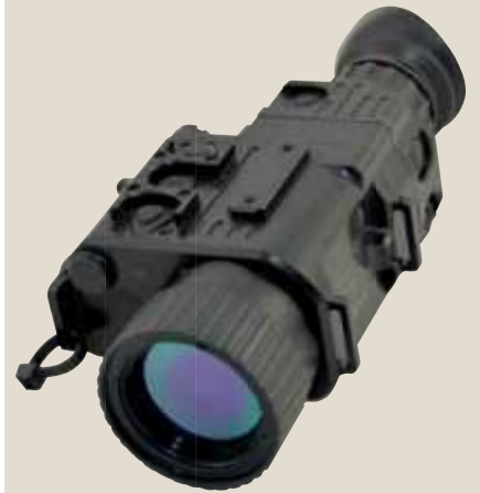
Liemke M 640