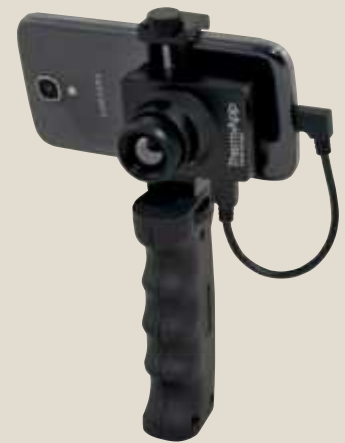
Obgal Therm-App HZ