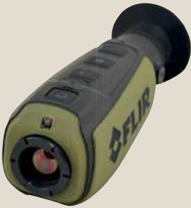
FLIR Scout II 640