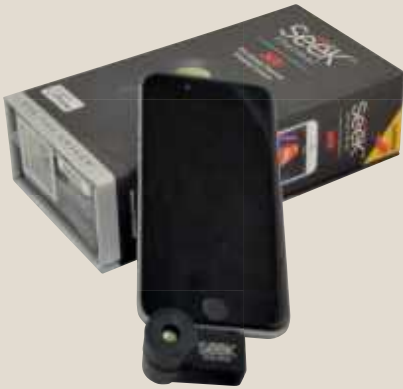
Seek Thermal XR