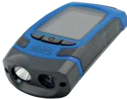
Seek Thermal Reveal